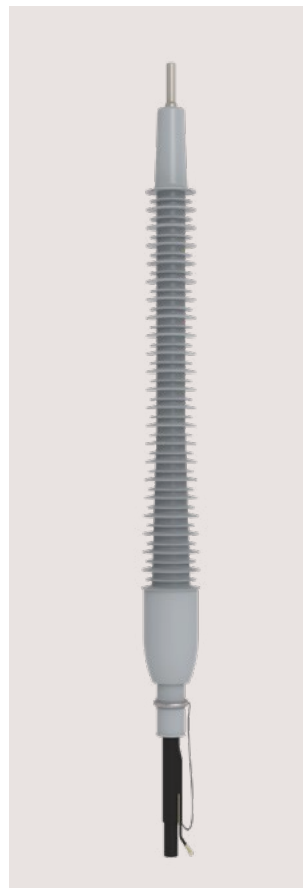
ESF 52 - 170 kV